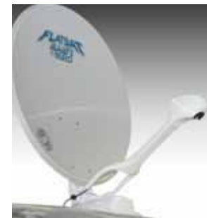
Parabolantenne Y0352 EasySat 85 cm. Automatische Sendersuche. Für Nachmontage