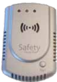
Gas Safe Y0397 Inverter Y0395

Omnistor 4,5 Meter, silbermetallic (750). Omnistor 4,0 Meter, weiß (700). (Serienmäßig im i810 und Royal 880.)