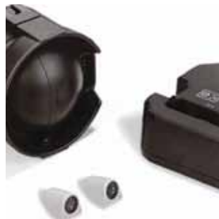
Einbruchalarm Y0167 Alarm innen, ausgestattet mit IR- und Mikrowellensensoren, wird über die normale Fernbedienung der Zentralverriegelung aktiviert. Einbruchschutzfunktion.

IR-Detektor Y0315 Wird zusammen mit der Alarmfunktion verwendet