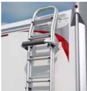
Leiter Y0319, Y0404

Seitz. Windschutzscheibe und Seitenfenster, Fahrerhaus