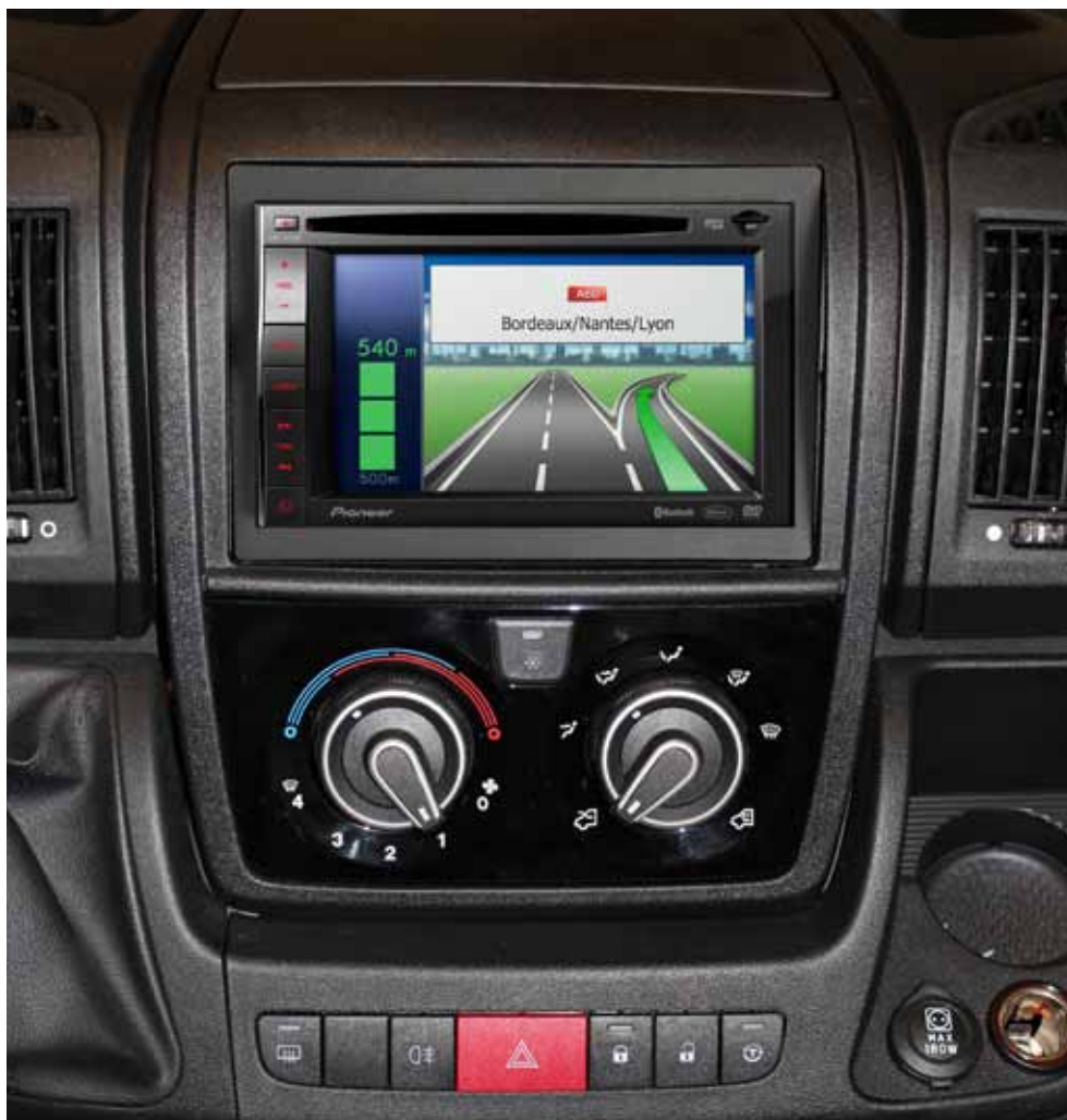
GPS und rückfahrkamera PIONEER AVIC-F920BT/ND-BC2 Y0364

Dieses Zubehör bietet eine Menge von praktischen Funktionen und Unterhaltung unterwegs. Das System wird als eine Einheit in das Armaturenbrett des Wohnmobils integriert.