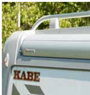
Dachreling Y0337, Y0402 Lastenträger Y0347