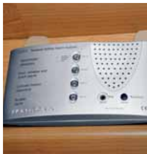
Sicherheitsalarm Y0314 Alarm für u.a. schwere und leichte Betäubungsgase, Gasleckage und Brandrauch.

IR-Detektor Y0315 Wird zusammen mit der Alarmfunktion verwendet