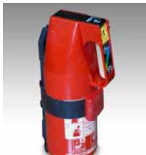
Feuerlöscher Y0355 Sicherheitskasten Y0382 / Y0383

Als Zubehör ist das GSM/GPS-Modul erhältlich Y0378