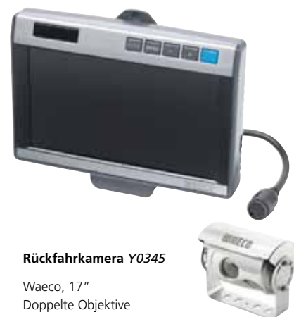
Rückfahrkamera Y0345 Waeco, 17" Doppelte Objektive