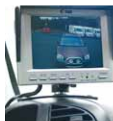
Rückfahrkamera Y0317 LCD-Farbmonitor Kamera mit Mikrofon